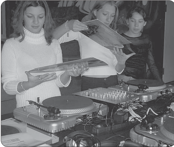
Workshop für angehende DJanes.