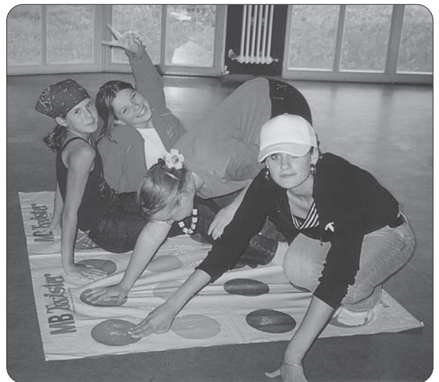
„Spiele, Spaß und vieles mehr“ beim Mädchentreff.

Zweimal im Jahr fanden Computerwochen statt, bei denen Bildbearbeitung, Gestaltung von Visitenkarten, Frisurenstyling und ein kostenloser Zugang ins Internet angeboten wurden. Auch außerhalb der