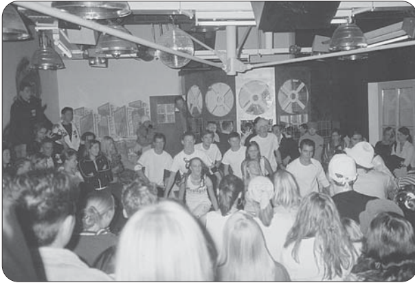
Streetdancebattle: Tänzer und Tänzerinnen aus dem Jugendtreff Thingers treten gegen ihre Gäste aus dem Jugendhaus an der Landwehrstraße an.

Beim Aktiv-Sommer-Programm nahmen viele Jugendliche aus dem Stadtteil zum zweitenmal am „Spiel ohne Grenzen“ auf dem Freigelände vor dem Jugendtreff teil.