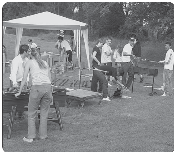
Der Jugendtreff geht nach draussen und verlegt den offenen Betrieb an die Sankt Manger BMX-Bahn.

Wie jedes Jahr war der Disco-Betrieb im Jugendtreff eines der wichtigsten Angebote für die Jugendlichen. Vor allem die Nachfrage nach Partys ist groß.