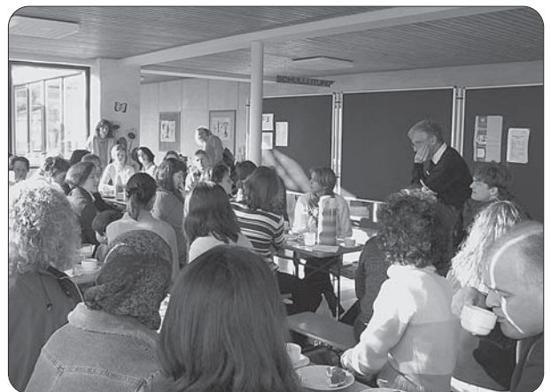
Einen großen Zuspruch erfährt das Elternfrühstück in der Nord-schule.

Für die Sij Thingers war sicher auch der Besuch einer spanischen Delegation mit Vertretern des Bayerischen Jugendrings ein Höhepunkt des Jahres. Der Bayerische Jugendring hatte ja bereits 2003 bei den parlamentarischen Abenden im Landtag der Sij Thingers ermöglicht, ihr Konzept der außerschulischen Bildungsarbeit in Schule und Jugendtreff wichtigen Politikern aus Bayern vorzustellen. Nun wurde dies auch für Vertreter von Parteien und jugendpolitischen Organisationen aus Nordspanien möglich. Ganz speziell interessierten sich die Gäste von der iberischen Halbinsel für Partizipationsformen von