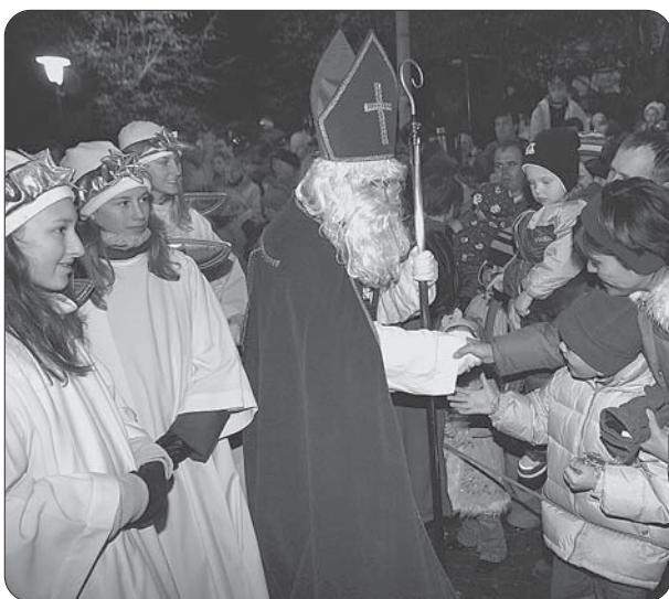
2400 Geschenke verteilte der Stadtnikolaus bei seinem Zug durch die Kemptener Innenstadt. Mit dabei war diesmal das Bayerische Fernsehen.