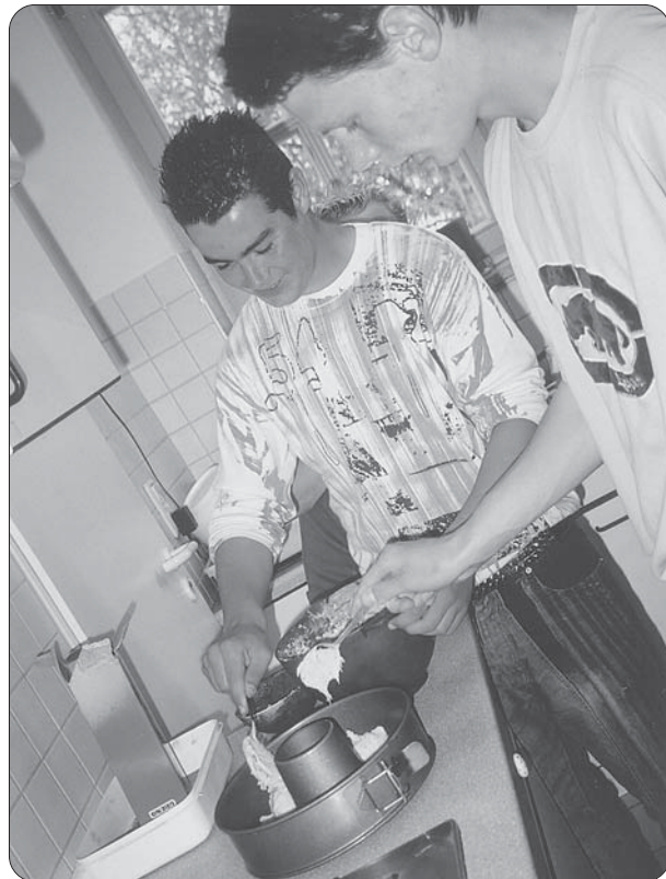
Kuchenbacken im Montagsclub.

Viele Jugendlichen nutzten die Gelegenheit, während des offenen Betriebes im Jugendtreff oder auf der Straße, Fragen zu stellen und sich Informationen zu beschaffen. Für weitere Beratung und Begleitung konnten hier dann Termine verabredet werden. Hauptsächlich betraf es Themen wie Schule, Ausbildung, Umgang mit oder Begleitung zu Ämtern, aber auch rechtliche Fragen.