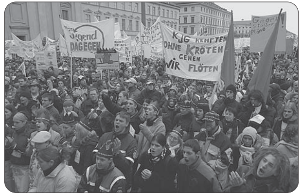
11000 Jugendliche demonstrierten am 10. Januar 2004 in München gegen Mittelkürzungen in der Jugendarbeit.

„Hier passiert bald nix mehr. Die Jugendarbeit in Bayern blutet aus“ – unter diesem Motto werden am Samstag auch Allgäuer Mitarbeiter der Jugendarbeit wegen der geplanten Kürzungen im Jugendprogramm der Bayerischen Staatsregierung in München auf die Straße gehen. Mit einer Großdemonstration ruft der Bayerische Jugendring (BJR) landesweit zum Protest auf. Der Anlass: 2,5 Prozent muss das Kultusministerium im Etat insgesamt einsparen - im Jugendbereich wird von 30 Prozent Kürzungen mit einer Sparsumme von 7,6 Millionen Euro gesprochen.