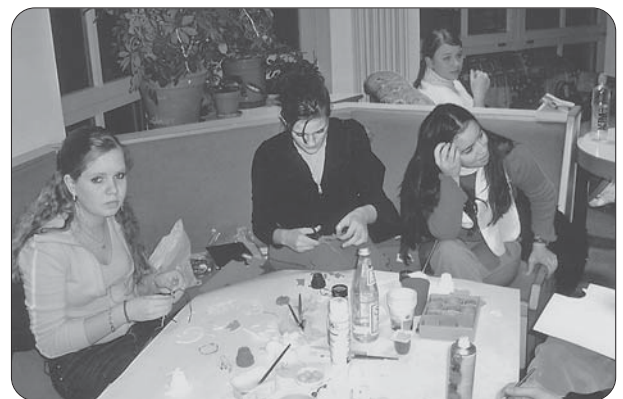
Basteln für den Weihnachtsmarkt.

Es wurde geschwommen, Volleyball und Fußball gespielt oder auch einmal gekegelt. Ein weiterer Programmpunkt, der von den Jungs wieder angefragt wurde, war das integrative Trampolinspringen bei unseren mittlerweile schon guten Bekannten von der Tom-Mutters-Schule. Dass hierbei alle Spaß hatten, war offensichtlich. So weitete sich das Trampolinspringen in der einen Hälfte der Halle in ein buntes Treiben mit Jonglieren, Basketball, Frisbee, Fußball, Ringe werfen, Medizinbälle rollen spontan auf die ganze Halle aus. Hierbei ein großes Dankeschön und