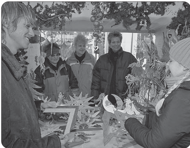
Zugunsten sozialer Projekte oder der eigenen Jugendarbeit wurde beim Weihnachtsmarkt vorwiegend Selbstgebasteltes verkauft.

deten, sprachen für regen Geschenkekauf. Selbstgebasteltes gab es beim Weihnachtsmarkt des Stadtjugendrings. An 21 Ständen boten Vereine, Organisationen, Schulen und Jugendhäuser selbst gefertigte Waren an. Da gab es Marmelade in Omas Einmachglas, Leckereien wie Waffeln und Plätzchen, kunstvoll verzierte Adventskränze, romantische Engel, Keramik, witzig-bunte Türreiter und mit Federn geschmückte Blumenstecker aus Holz, Kerzen in allen Größen, Bilderrahmen und Kunst aus Bolivien. Viel Arbeit hatten sich die jungen Leute gemacht. Viel leisten mussten Jugendfeuerwehr und Technisches Hilfswerk (THW), die für Aufbau und Stromversorgung verantwortlich waren. (...)