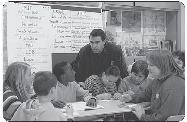
Eine feste Größe an der Nordschule ist die Aktion „Miteinander Umgehen Trainieren – MUT“.

Die Schüler-Patenschaften sind zum Selbstläufer geworden. Genau wie gewünscht, bestehen nun schon über zwei Jahre hinweg Kontakte zwischen Kindern der Grundschule und der Hauptschule. Aber nicht nur durch Aktionen, bei denen die Klassen zu-