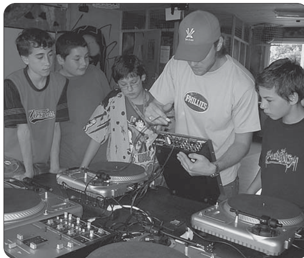
Workshop für angehende DJs.

Der Großteil der Besucher/innen geht noch zur Schule. Vorwiegend besuchen sie die Hauptschule, vereinzelt die Realschule. Einige Jugendliche sind auch an weiterführenden Schulmaßnahmen, z.B. dem Berufsgrundschuljahr beteiligt, da sie oft, bedingt durch den derzeitigen Stellenmarkt, keinen