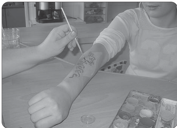
Bodypainting als kreatives Angebot.

Wichtig war auch die Zusammenarbeit mit der Hauptschule auf dem Lindenberg. Neben der wöchentlichen Unterstützung im Mittagscafé der Schule durch eine Mitarbeiterin des Jugendtreffs erhielten die Schüler/innen Angebote für Aktivitäten am Nachmittag. Dabei wurde zweimal ein Basketballturnier