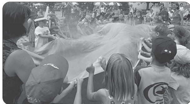
„Abkühlung pur“ beim Kindertag auf dem St.-Mang-Platz.

Sie turnten und tanzten, kraxelten und zeigten sich als gewiefte Flohmarkt-Krämer: Die Kinder waren beim Altstadt- und Kinderfest die Größten und strahlten mit der Sonne um die Wette. „Das ist ein Fest, so schön, wie ich lange keines gesehen habe“ schwärmte eine Besucherin. Wie sie waren am Samstag zahlreiche Menschen rund um den St.-Mang-Turm unterwegs beim „Feschtle feiern“.