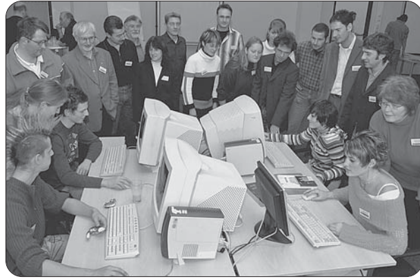
Eine Woche lang konnten sich „Sozialprofis“ bei der Multiplikatoren-Schulung in der BigBOX zum Thema „Sucht“ informieren und weiterbilden.