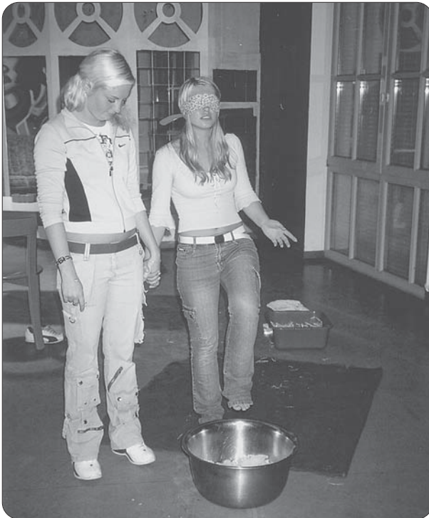
„Mit allen Sinnen“ – ein Fühl-, Tast und Hörparcours.

Der Montagsclub wurde aus diesem Grund eingerichtet. Er bestand zwei Jahre lang aus einer festen Gruppe von zunächst fünfzehn, dann zwanzig Jugendlichen zwischen 14 und 17 Jahren. Später wurde das Alter auf 21 Jahre erhöht. Für den Clubbetrieb wurden die Räume des Jugendtreffs genutzt. In der gemeinsamen Programmplanung wurden Aktionen wie Kochen, Hausturniere, Film- oder Spieleabende, aber auch Kreatives gewünscht. Die tatkräftige Mithil-