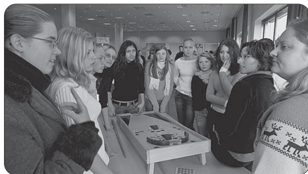
„Alles klar?!“ hieß eine Station des Suchtparcours „Abenteuer Leben“. Dabei ging es um Fragen rund um Alltag, Beruf und Partnerschaft.