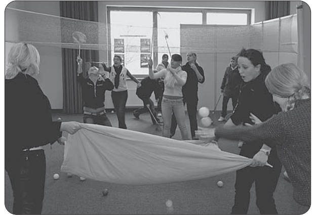
Multiplikatoren-Schulung in der BigBOX: Beim Suchtparcours ging es nicht nur um reine Wissensvermittlung, sondern auch um den Zusammenhalt in der Gruppe.

Allen Sponsoren ein herzliches Dankeschön.