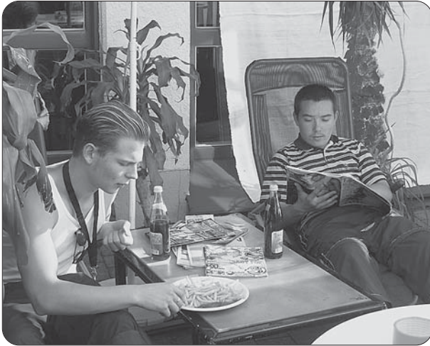
Der offener Betrieb ist das Kernstück der Arbeit im Jugendtreff und manchmal auch eine „Oase der Ruhe“.

hungen, das friedliche Zusammenleben der unterschiedlichsten Jugendlichen zu fördern, bildete vor allem die Integration der neuen Besucher ins Haus einen Schwerpunkt.