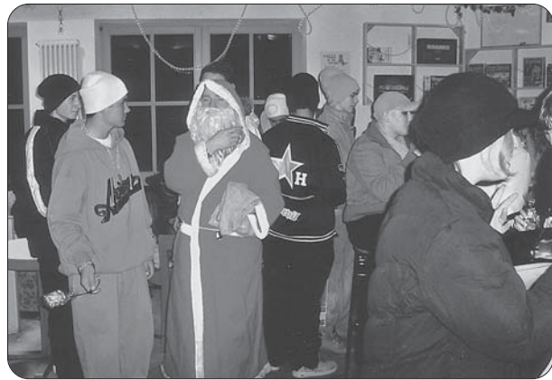
X-mas-Party im Jugendtreff.

Als besonderes Unterstützungsangebot für Ausbildungsplatzsuchende etablierten sich die „Bewerbungswochen“, die inzwischen jährlich im März und Oktober stattfinden. Hier konnten die Besucher/innen die Homepage der Agentur für Arbeit besuchen und Informationen über Ausbildungsmöglichkeiten einholen sowie Ausbildungsangebote kopieren. Etliche Jugendliche nutzten die Gelegenheit, im Jugendtreff einen Berufsberater der Agentur für Arbeit nach Chancen und Möglichkeiten zu befragen. Außerdem übten Ausbildungssuchende im Rollenspiel Vorstellungsgespräche. Zusätzlich konnten sich Jugendliche an zwei Tagen in der Woche von einer durch die Aktion Mensch finanzierten Fachkraft zu Berufsschule, Bewerbungen und Ausbildungsstellensuche beraten lassen.