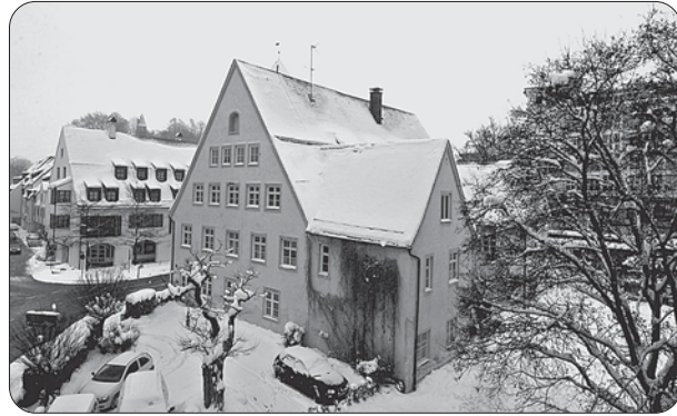
(Vorläufig) auf Eis liegt die dringend notwendige Sanierung des Gebäudes Kronenstraße 1 mit seinen Jugendgruppenräumen und der Geschäftsstelle des Stadtjugendringes.

Jugendtreff Thingers: u.a. Boxen in der Disco erneuert; Keller ausgeräumt und renoviert wegen Trockenlegung nach Wassereintrich; neuer Raum für die Aktion Mensch eingerichtet; Theke in der Cafeteria neu gestaltet; Base außen neu gestaltet (u.a. Spiegelkacheln); Billardtisch neu bezogen und Kicker instandgesetzt.