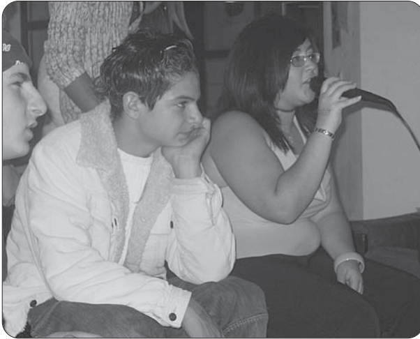
Karaoke-Wettbewerb bei der Open-Air-Party: Viele Jugendliche testeten ihre Talente.

So fanden auch im Jahr 2004 wieder einige besondere Tanzveranstaltungen statt. Unter anderem muss hier die Single-Party mit einer Herzblatt-Einlage genannt werden. Ein voller Erfolg war auch die Open-Air-Party, bei der der Karaoke-Wettbewerb Sängerinnen und Sänger aus Sankt Mang ihr Bestes geben ließ.