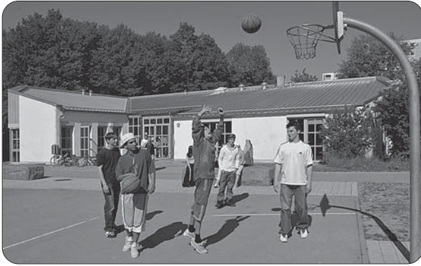
Streetballplatz im Bürgerpark vor dem Jugendtreff Thinkers.