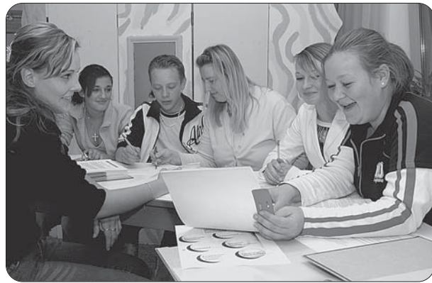
Aktion Mensch: Integrationsfördernde Nachhilfe für Auszubildende im Jugendtreff Thingers.

Die Zusammenarbeit der offenen Jugendarbeit des Stadtjugendringes Kempten mit den Schulen wurde 2004 nochmals nachhaltig vertieft. Am 1. November gelang es, ein neues Projekt der sozial-integrativen Jugendarbeit an der Robert-Schuman-Schule