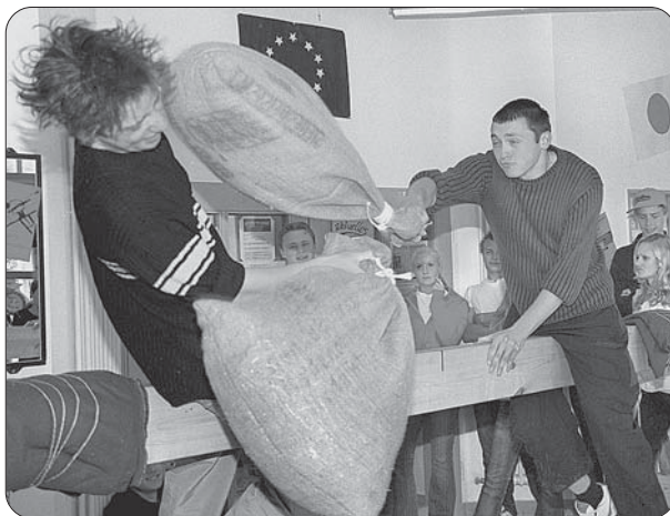
Aktiv Sommer 2004: Spiel ohne Grenzen im Jugendtreff und Bürgerpark Thingers.